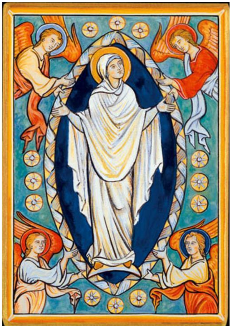
L'Assomption de la Vierge Marie (Bénédictines de l'Abbaye Notre-Dame-de-Fidélité, Jouques)